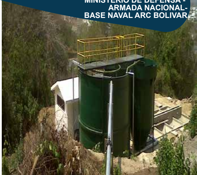
MINISTERIO DE DEFENSA - ARMADA NACIONAL - BASE NAVAL ARC BOLIVAR

Construcción, montaje, instalación, puesta en marcha de una planta de tratamiento de aguas residuales domésticas a todo costo, en el batallón de fuerzas especiales de infantería de marina zona Manzanillo del Mar, de acuerdo a especificaciones técnicas.