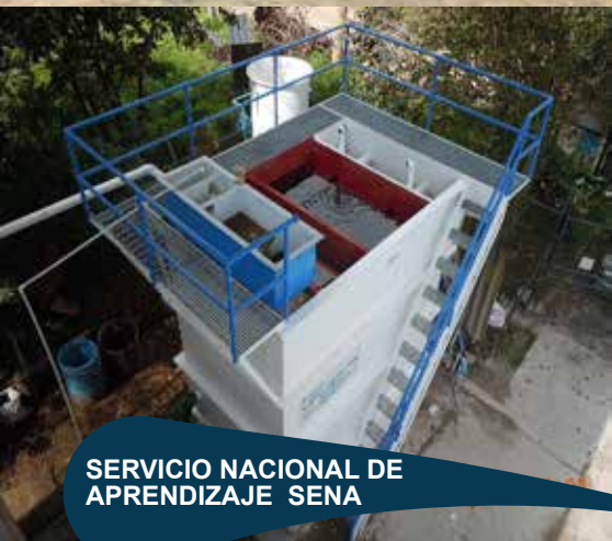
SERVICIO NACIONAL DE APRENDIZAJE SENA

Adecuación, adquisición, instalación y puesta en funcionamiento de una planta compacta de tratamiento de aguas subterráneas (potable) y de una planta de tratamiento de aguas residuales para el centro de biotecnología agropecuaria del Sena, regional Cundinamarca.