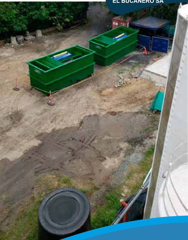
CARGILL - POLLOS EL BUCANERO SA

Suministro de Floculador Sedimentador para 50 lps.