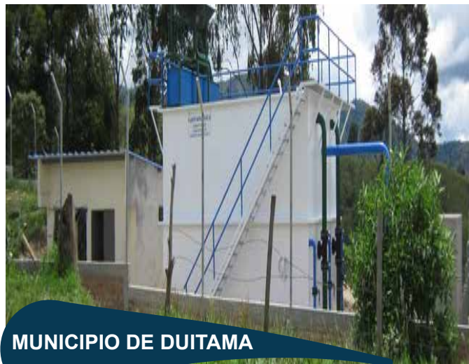
MUNICIPIO DE DUITAMA

Mejoramiento y optimización de los acueductos veredales de San Antonio Norte, la Florida Sirata Centro, la Parroquia, Sirata la Cumbre y Espinal de la ciudad de Duitama.