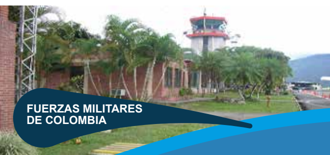
FUERZAS MILITARES DE COLOMBIA

Elaboración de planes de manejo ambiental en diferentes unidades del ejército.