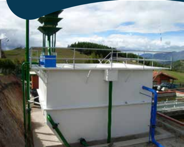
COSERVICIOS SA ESP COMPAÑÍA DE SERVICIOS PÚBLICOS DE SOGAMOSO S.A. ESP

Diseño optimización y puesta en marcha del sistema de tratamiento de agua potable, planta del mode morca municipio de Sogamoso.