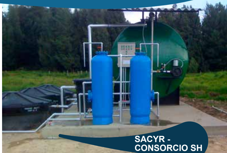
SACYR - CONSORCIO SH

Suministro y puesta en marcha de sistema de reutilización de aguas en el Frigorífico Guadalupe 20 lps.