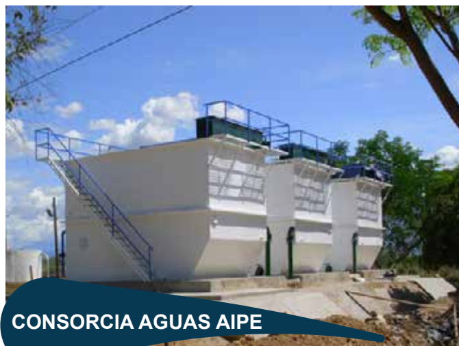
CONSORCIA AGUAS AIPE

Suministro planta de tratamiento de agua potable del tipo modupack 60 lps.