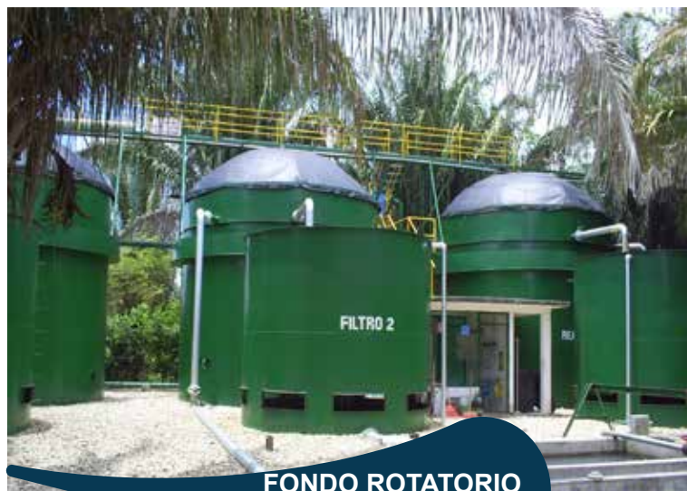
FONDO ROTATORIO DE LA ARMADA NACIONAL

Construcción de la planta de tratamiento de agua residual del municipio la Celia.