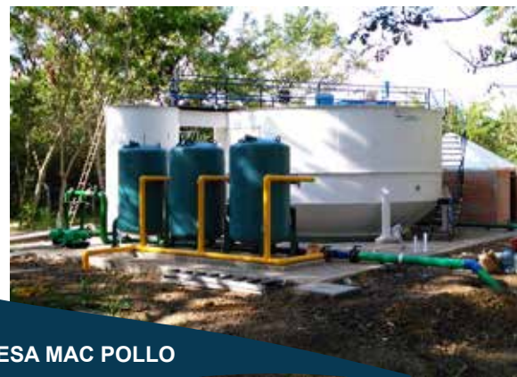
AVIDESA MAC POLLO

Obra civil para construcción de planta de tratamiento de agua tipo accelapack capacidad 30 I.P.S.