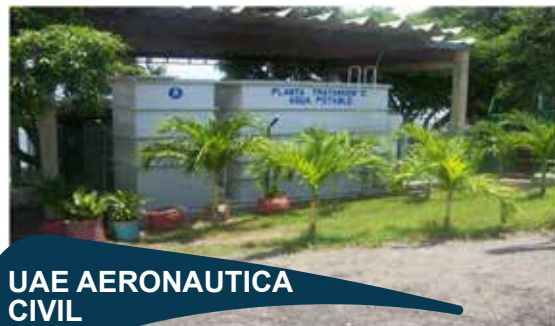
UAE AERONAUTICA CIVIL

Contratar el mantenimiento y operación de los sistemas de tratamiento de aguas residuales, red de alcantarillado e industriales del aeropuerto de Santa Marta.