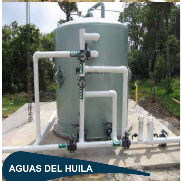
AGUAS DEL HUILA

Contratar la implementación del programa de mejoramiento para la prevención del peligro aviario en los aeropuertos de Bucaramanga, Leticia, Ibagué y Rionegro.