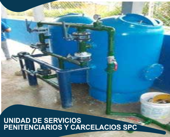
UNIDAD DE SERVICIOS PENITENCIARIOS Y CARCELARIOS SPC

Mantenimiento correctivo y las adecuaciones requeridas para los equipos y sistemas que componen las plantas de tratamiento de aguas potable ptap, incluye suministro, instalación y puesta en marcha de la planta de tratamiento de agua potable para el epcms de Leticia.