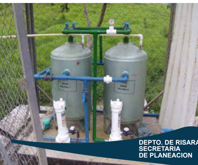
DEPTO. DE RISARALDA SECRETARIA DE PLANEACION

Diseño, construcción, suministro y puesta en marcha de sistemas de plantas de tratamiento de agua potable compactas contrato no.129 diseño, suministro e instalación de ptap modupack de 16 lps - 20 lps - minipack de 6 lps, 2lps, 3 lps, municipios de Pitalito, Acevedo, Pital, San Agustín, Timana, Oporapa, Paicol. Departamento del Huila incluye manual de operaciones, mantenimiento, inducción, entrenamiento a los operadores, fontaneros y comunidad en general, al igual que la capacitación del uso eficiente del agua (40 horas).