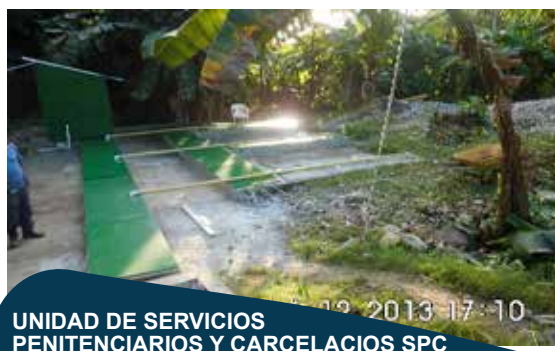
UNIDAD DE SERVICIOS PENITENCIARIOS Y CARCELARIOS SPC

Mantenimiento correctivo y suministro, instalación y puesta en marcha de una planta compacta de tratamiento de aguas residuales para de capacidad de 30 m 3 /día en epmsc San Andrés Islas.