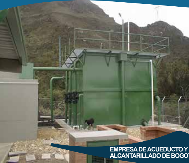
EMPRESA DE ACUEDUCTO Y ALCANTARILLADO DE BOGOTA

Diseño, suministro, construcción puesta en funcionamiento y operación de los componentes que conforman el sistema de producción y las obras anexas del proyecto de acueducto, quebrada yomasa -localidad de Usme.