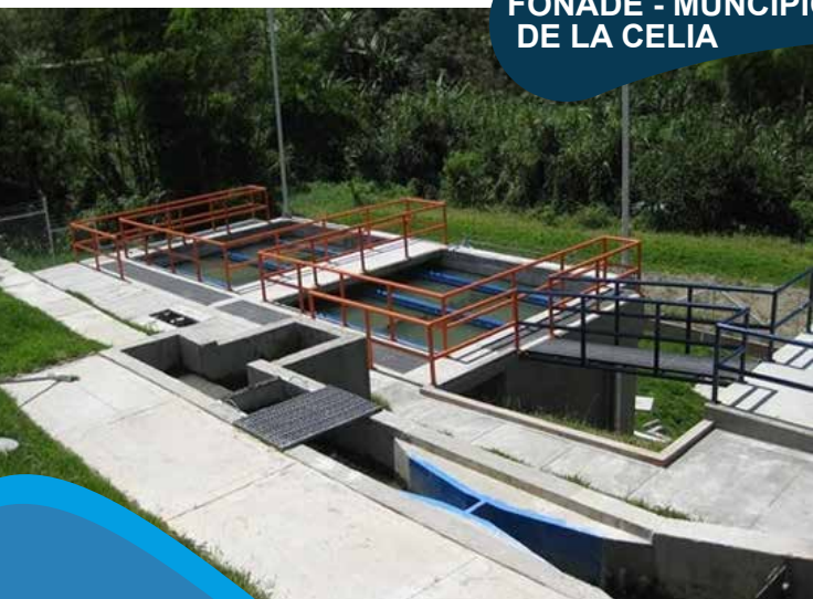
FONADE - MUNICIPIO DE LA CELIA

Construcción y cerramiento planta de tratamiento de agua potable acueducto vereda Aposentos y construcción de lechos filtrantes del acueducto municipal.