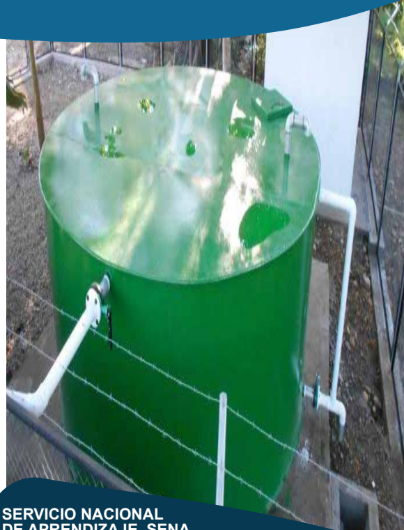
SERVICIO NACIONAL DE APRENDIZAJE SENA

Contratar la construcción de obras complementarias al sistema de acueducto y alcantarillado, así como la operación y funcionamiento de las mismas para el centro agroindustrial, sede el Hachon de la regional Meta.