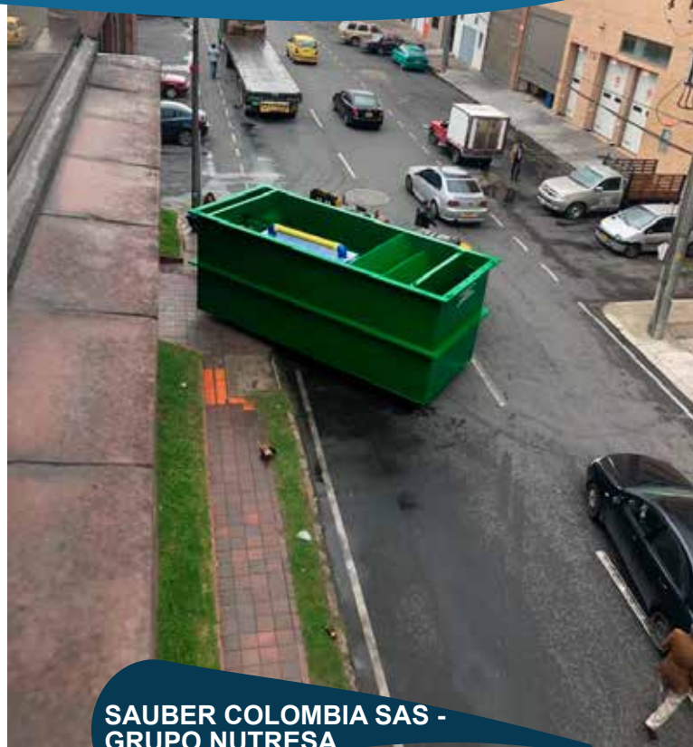
SAUBER COLOMBIA SAS - GRUPO NUTRESA

Diseño suministro y puesta en marcha PTAR 25 m 3 día.