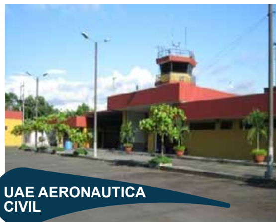
UAE AERONAUTICA CIVIL

Contratar el mantenimiento y operación de los sistemas de tratamiento de aguas residuales, red de alcantarillado e industriales de los aeropuertos de Armenia, Buenaventura, Guapi, Ipiales, Pasto y Tumaco de la dirección regional aeronautica del Valle.